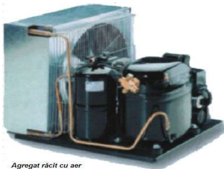
Agregat răcit cu aer Embraco-Aspera